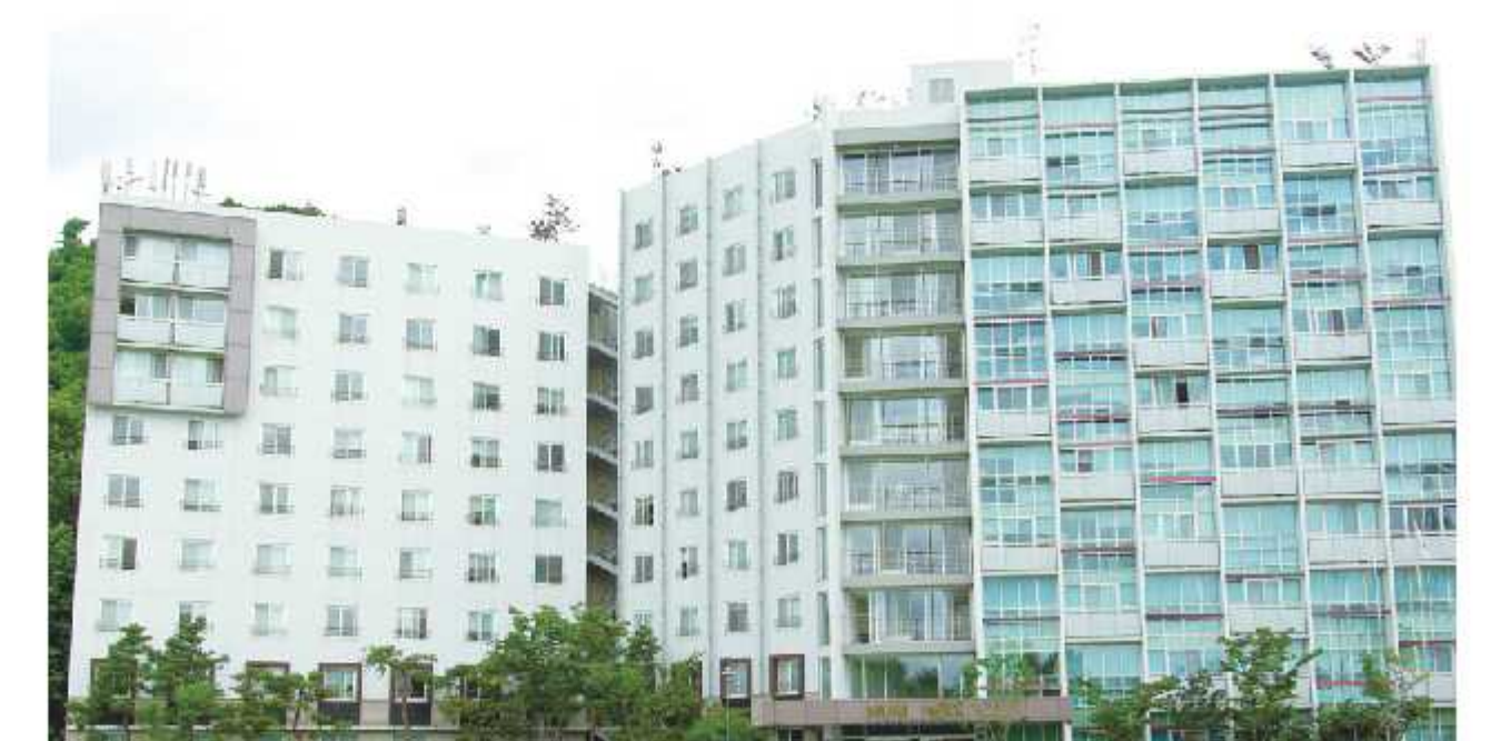
누리관 (외국인 유학생 기숙사)

주요시설: 공연장, 무빙헬터, 광장, 관리동, 야외분수 등 문의: 042) 250-1400 www.expoplaza.or.kr