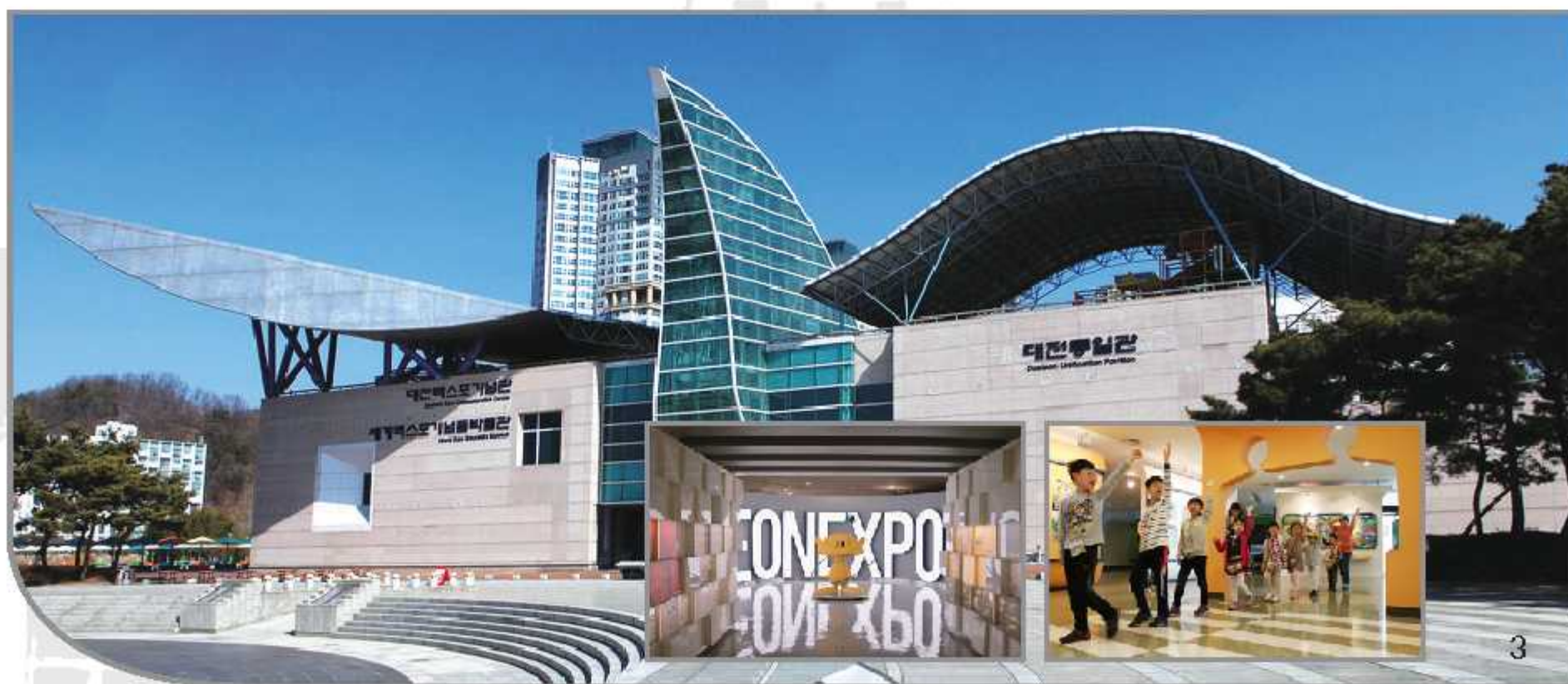
1.한빛탑 2.엑스포 음악분수 3.세계엑스포기념박물관

우리나라 첨단의료관광의 허브도시 대전에서 고품격 의료서비스와 첨단과학, 문화관광을 경험하세요