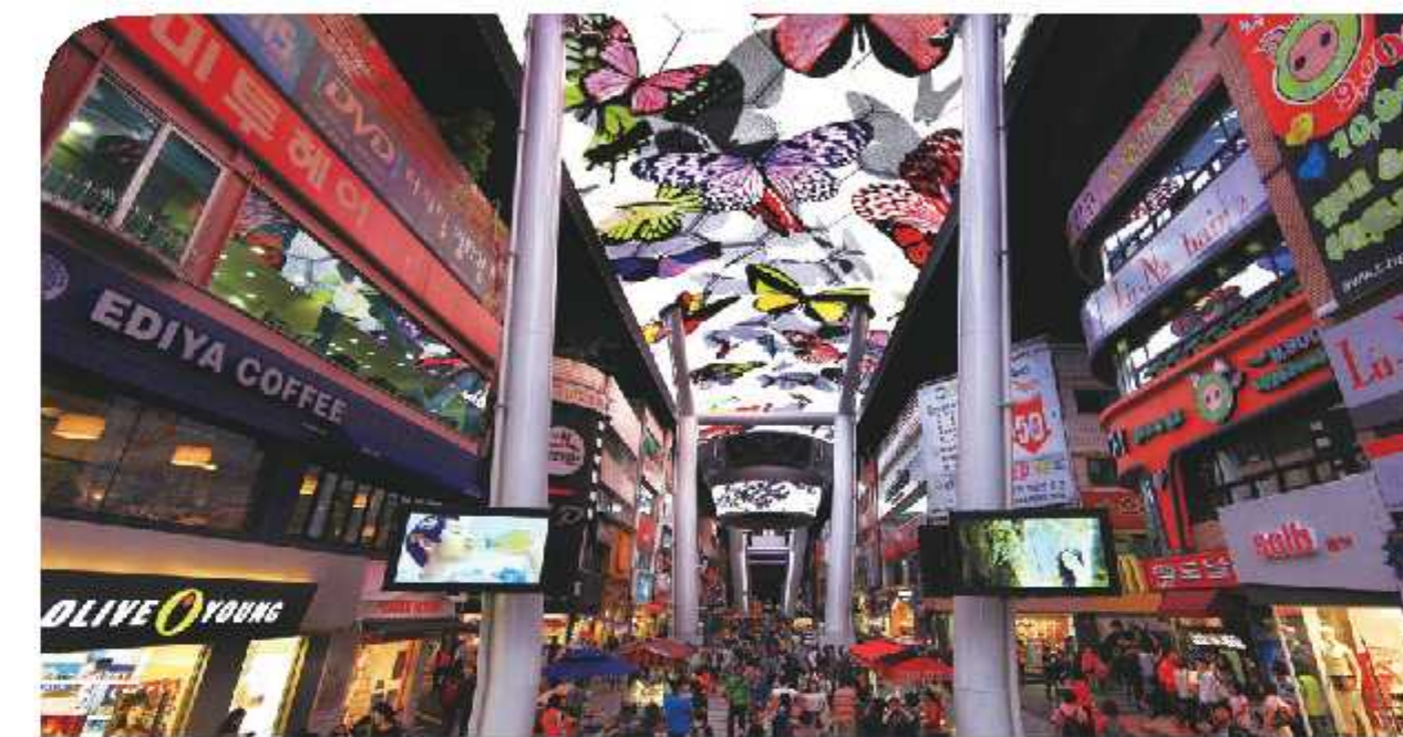
대전스카이로드 (응능정 LED거리)

국내 최초로 설계된 도심속 대형 LED 영상스크린을 통하여 다양한 예술작품과 첨단기술의 향연을 즐길 수 있습니다.